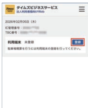
1 マイページトップの利用端末から「登録」をクリック