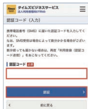
3 SMSに届いた認証コードを入力し「認証」をクリック